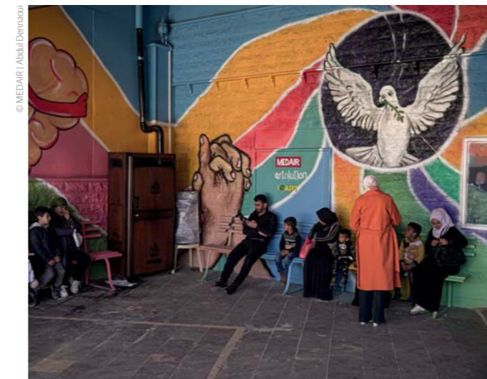
Ein fertig gestelltes Wandbild in dem von MEDAIR unterstützten Zentrum für medizinische Grundversorgung in Seraaine im Bekaa-Tal.

Nicht nur im Libanon ist Kunst Teil des Lehrplans, sondern auch in der Ukraine, in der MEDAIR mit Unterstützung des Auswärtigen Amtes ebenfalls Kurse zur Verbesserung der psychischen Gesundheit und psychosozialen Unterstüt-