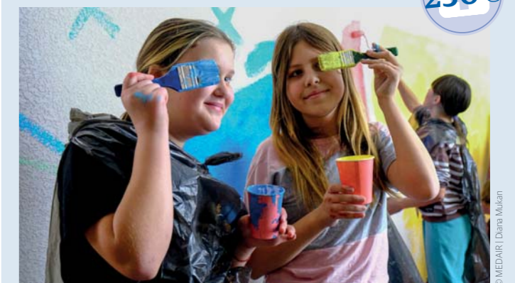
In der Ukraine ist Kunst nun ebenfalls Teil des Lehrplans. Die besondere Form der Therapie hilft auch Kindern.