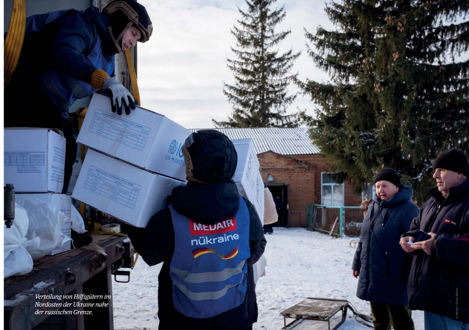
Verteilung von Hilfsgütern im Nordosten der Ukraine nahe der russischen Grenze.

Der Konflikt führt zu Mas- senvertreibungen, Armut, Unterernährung und Krank- heitsausbrüchen. Wir beten für die Menschen im Kongo, unsere Kolleginnen und Kollegen und ein Ende der Auseinandersetz- ungen.